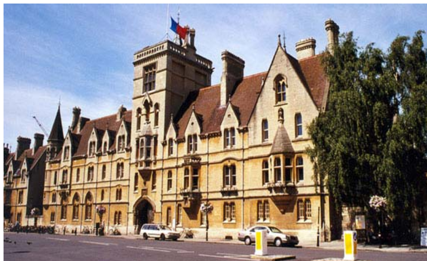
Balliol College, Oxford, locul unde a studiat și a predat Hare

Proiectul unificaționist al lui Hare se inspiră din metoda diaporematică a lui Aristotel: „Cea mai bună cale de a-ți proteja propria teorie este de a încorpora în ea toate adevărurile asupra cărora insistă susținătorii teoriilor rivale. Dacă, așa cum cred eu, aproape toate teoriile etice conțin un anumit element de adevăr, cea mai bună cale de a construi o teorie viabilă este să aduni elementele de adevăr din fiecare și să le folosești pentru construirea propriei teorii. Îți sfătuiesc să faci acest lucru pe toți cei ce urmăresc o carieră în filosofie”. Ceea ce propune Hare este așadar o teorie unificată a moralei, fundamentată în stil kantian, adică a priori , locul „metafizicii moravurilor” fiind luat acum de o logică a limbajului moral (o anume meta-etică).