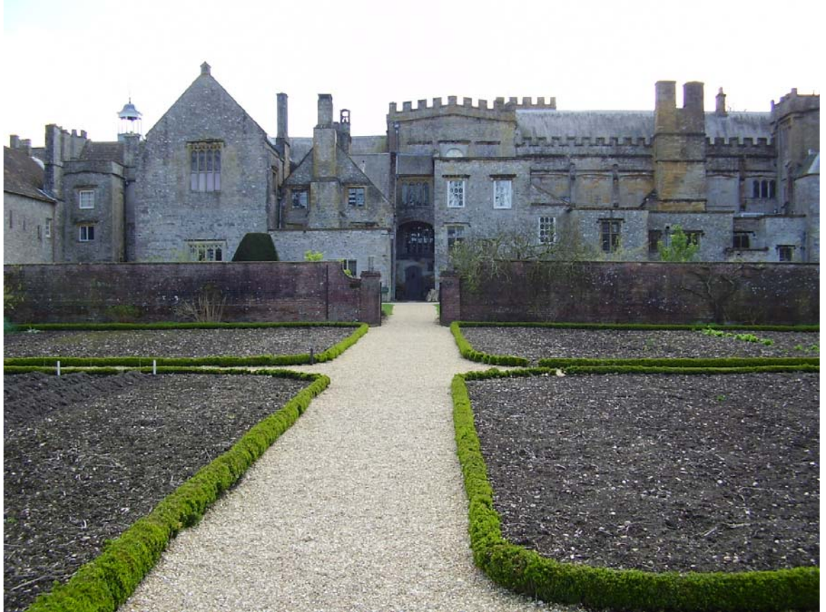
Ford Abbey – conacul lui J. Bentham, unde tânărul Mill își petrecea verile.

împlinirea personală, solidaritatea, respectul, autonomia. Aceste bunuri pot primi ponderi iar criteriul corectitudinii unei acțiuni va consta în faptul că respectiva acțiune trebuie să contribuie cel mai mult la creșterea sumei ponderate a acestor valori pe termen lung. De acest tip e utilitarismul lui D. Parfit, utilitarismul „pluralist” al lui P. Railton, dar și „utilitarismul ideal” al lui G. Moore. Ceea ce e interesant de reținut e că această formă de utilitarism e un consecinționism nehedonist . Rezultă că nu toate formele de utilitarism sunt hedoniste.