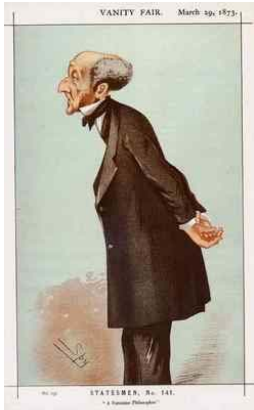
Caricatură a parlamentarului Mill.