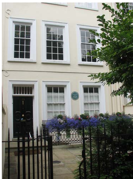
Casa lui Mill în Kensington, Londra

Mill nu a fost econom cu criticile adresate maestrului său, între altele și pentru că a ignorat diferențele calitative dintre plăceri, lăsând deschisă calea acuzațiilor de hedonism vulgar, „o doctrină demnă doar de porci”. Or, e o veche constatare aceea că plăcerile umane sunt diferite de cele animale tocmai prin natura lor diferită calitativ: plăcerile intelectuale, cele legate de exercitarea puterii politice sau plăcerile vieții morale sunt specific umane și de aceea calitativ superioare celor trupești (comune cu animalele) în așa fel încât nici o cantitate din cele inferioare, oricât de mare, nu egalează vreo cantitate din cele superioare, oricât de mică. Pe scurt, Mill susține că plăcerile sunt evaluabile cantitativ-calitativ și că există o ierarhie ordinală a lor: plăcerile intelectuale au o superioritate absolută - o cantitate M plăcere superioară nu e egalată de “nici o cantitate din cealaltă plăcere (fizică)”, oricât de mare ar fi aceasta din urmă (II, 5). Acesta e substratul celebrei sale afirmații: “E mai bine să fii un Socrate nesatisfăcut [fizic] decât un nebun [incapabil de plăceri superioare] satisfăcut” [fizic] (II, 6). Iată de ce se afirmă în literatura de comentariu că, spre deosebire de Bentham, J. S. Mill susține un “hedonism calitativ ”. În această abordare a utilitarismului, vom spune că o acțiune e corectă dacă maximizează cantitatea de plăceri superioare (și, în subsidiar, inferioare). Acesta e principiul millian al utilității .